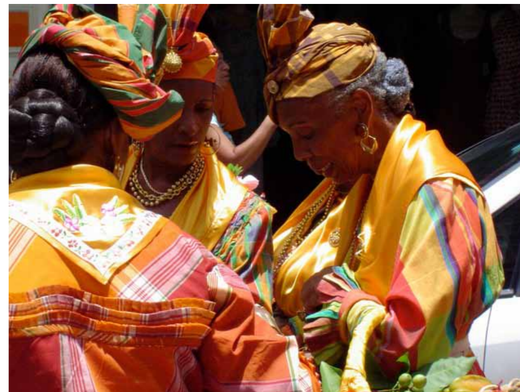
Cuisinières de Guadeloupe