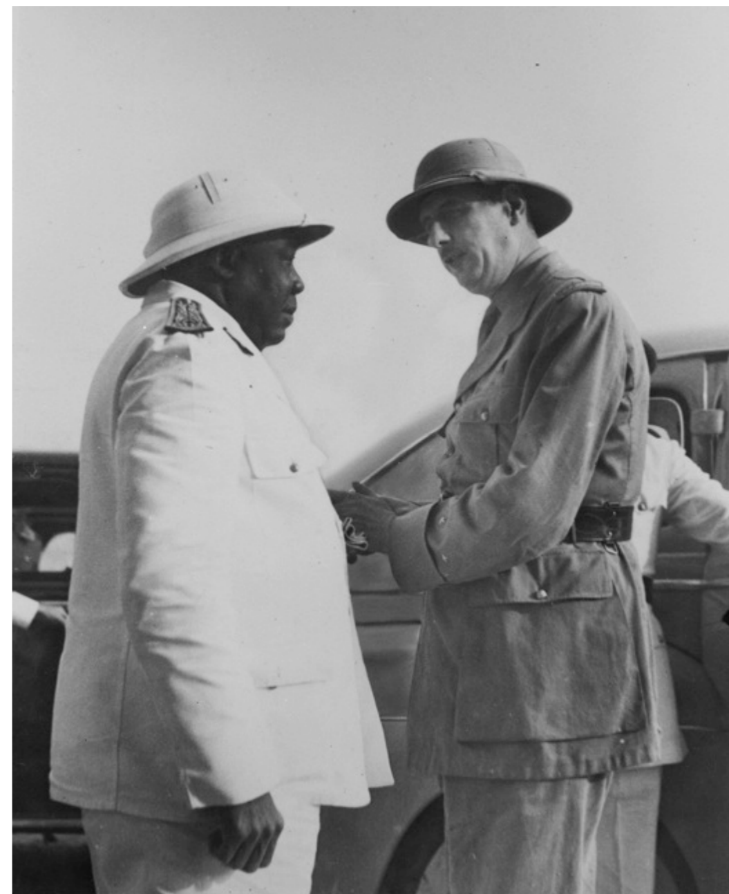
Le Général de Gaulle salue le gouverneur général Félix Eboué à Brazzaville en 1943, symbole de l'engagement de l'outre-mer dans la Libération.

Le Ministère de la Défense réalisera sur le site «Mémoire des hommes» , la mise en ligne gratuite d'une importante base de données concernant la traite et l'esclavage à partir de journaux de bord de la Compagnie des Indes .