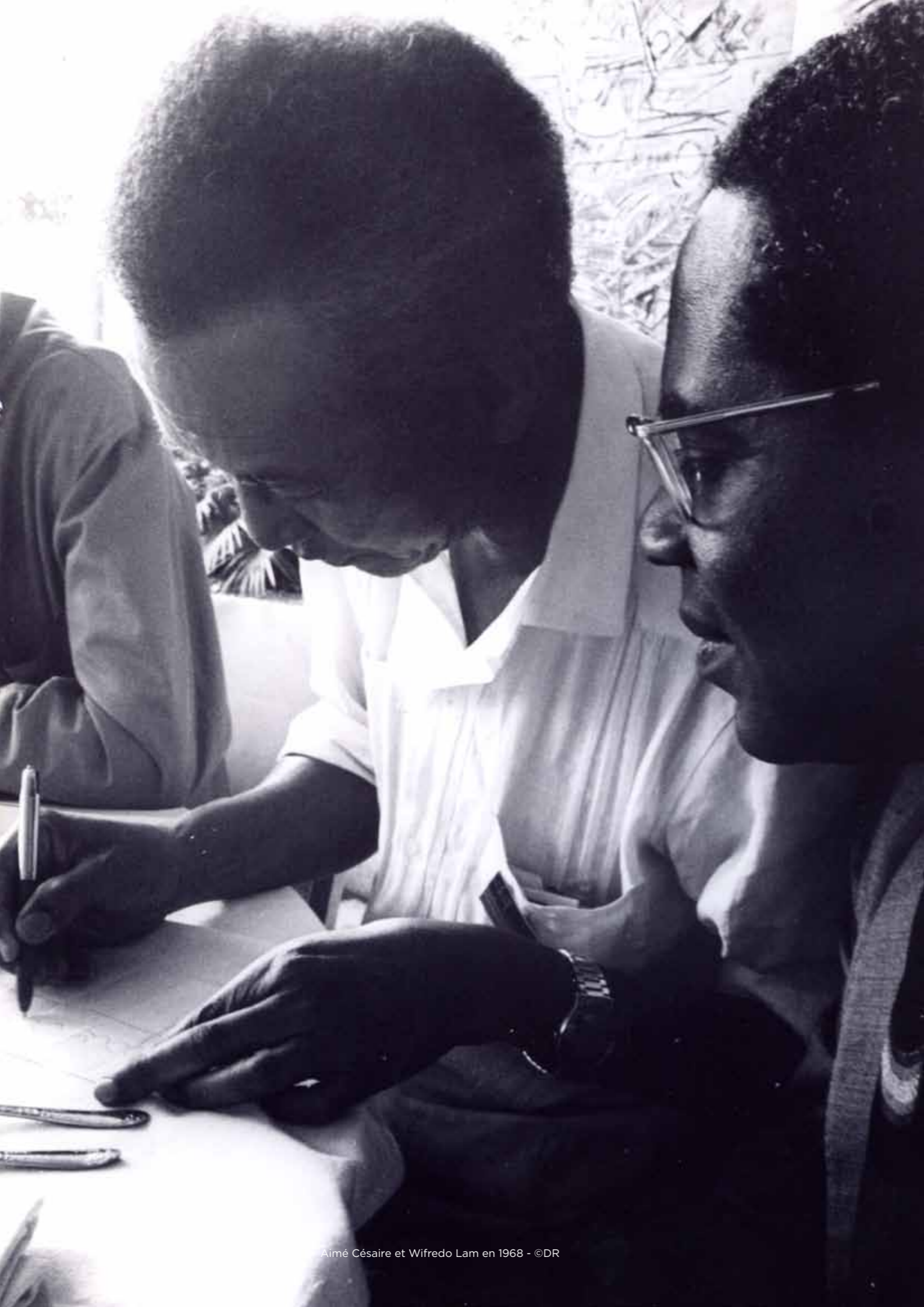
Aimé Césaire et Wifredo Lam en 1968