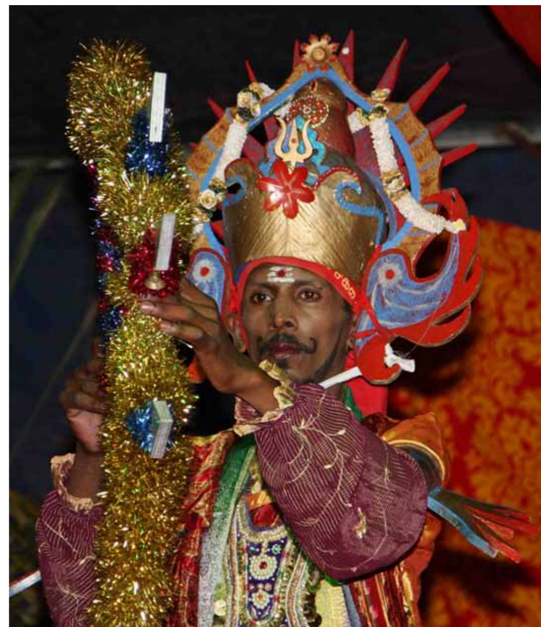
Bal Tamoul de La Réunion