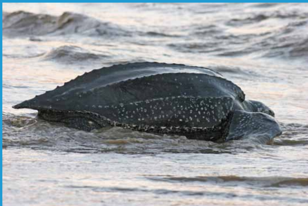
Tortue Luth

Des manifestations mettent en évidence le fait que l'outre-mer permet à la France d'être le deuxième espace maritime mondial.