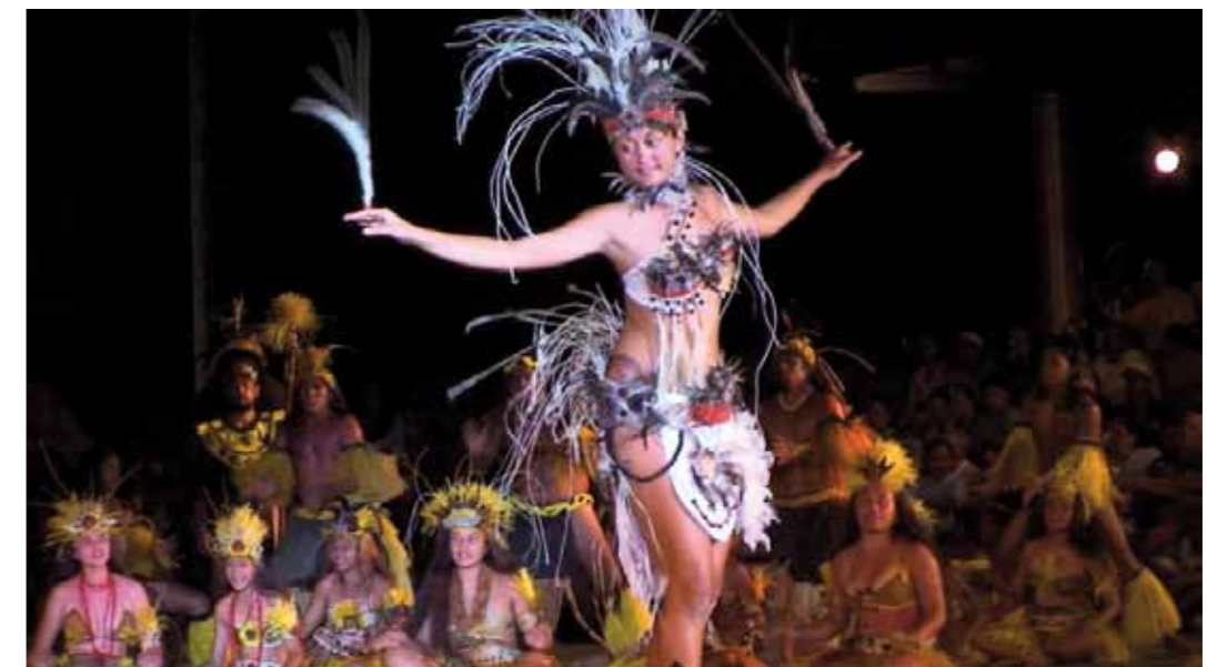
Danseuses à Nuku Hiva (Marquises)

Le cinéma sera bien présent tout au long de l'année. En Outre-mer où fleurissent des festivals d'envergure, notamment à La Réunion, en Polynésie et en Guadeloupe et en métropole au cours des grands rendez-vous traditionnels ou de manifestations spécifiques. Des rétrospectives sont en préparation (par exemple autour de l'œuvre d'Euzhan Palcy ) ainsi que des manifestations présentant la production de la nouvelle génération de cinéastes ultramarins. L'accent sera mis sur la nécessité de promouvoir les créations audiovisuelles émanant des Outre-mer pour aider à leur production et à leur diffusion, notamment dans le secteur de la télévision, aussi bien pour les documentaires que pour la fiction.