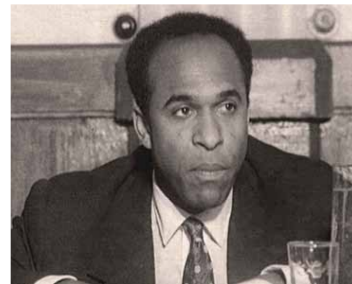
Franz Fanon