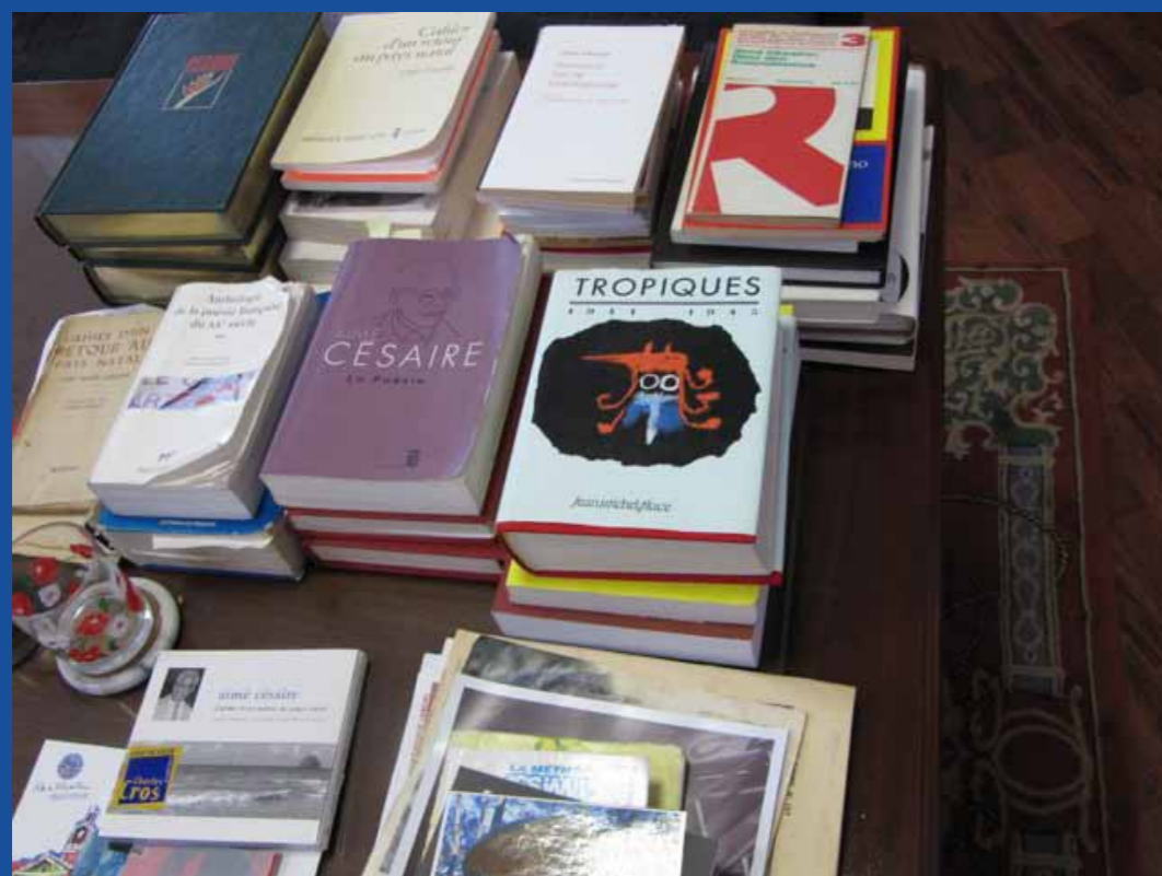
Dans le bureau d'Aimé Césaire