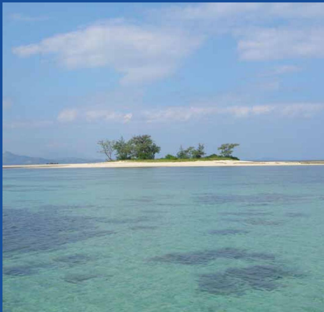
Guy Cabioch, Ilots corallien boisé en arrière d'un récif situé dans le lagon de Nouméa, Nouvelle-Calédonie - © IRD